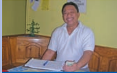
Schneller Geldtransfer in die Heimat ist jederzeit ein aktuelles Thema

wie schickt man so schnell und sicher wie möglich eine gültige Kreditkarte auf die Philippinen? Und was kostet das? Vor diesen Fragen stand ich Anfang Dezember, als mich ein philippinischer