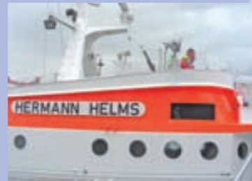
Die Besatzung der „Hermann Helms“ informiert immer wieder über verletzte Seeleute

reichlich Gepäck dabei, sein Reeder hat ihn von Dänemark aus hierher geschickt, um sich um den alten Schlepper zu kümmern und ihm zugesagt, dass bei seiner Ankunft alles bereit sei. Nix ist bereit... und sein Visum läuft am nächsten Tag ab! Wir essen gemeinsam im Seemannsheim eine Suppe und er bezieht eines unserer Gästezimmer. Am nächsten Tag bekommen wir den Agenten zu fassen. Er kümmert sich bestens um die Formalitäten, genau wie die Männer von der Bundespolizei wohlwollend ein neues korrektes Visum ausstellen. Der Seemann bekommt die Schlüssel für den Schlepper und ich bringe ihn samt Gepäck an Bord.