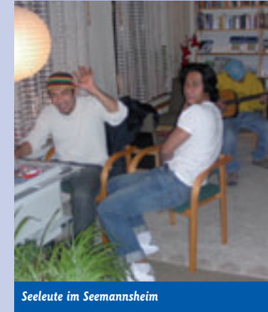
Seeleute im Seemannsheim

So haben wir zahlreiche Fahrten absolviert, um Menschen in das Seemannsheim und zurück an Bord zu bringen. Vermehrt wurde der Wunsch nach weiteren Öffnungsabenden geäußert, dem wir, wo es uns möglich war, gern nachgekommen sind. Allerdings klagten auch zahlreiche Seeleute über die große Entfernung des Seemannsheimes zum Hafen. Viele sagten, das ihnen der Aufwand für einen Besuch, grade wenn die Zeit knapp ist, zu groß sei und wünschten sich eine Anlaufstelle – im wahrsten Sinne des Wortes – direkt im Hafen. Leider haben wir bisher diesem Wunsch nicht nachkommen können, sind aber auf der Suche nach geeigneten Räumlichkeiten auf der Nordseite des neuen Fischereihafens.