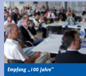
Empfang „100 Jahre“

Am 10. Juni begingen wir mit einem Empfang in der Stadtparkasse und der Ausstellungseröffnung „Seeleute im Blick“ den ersten Teil des offiziellen Geburtstages. Viele Menschen beglückwünschten, beschenkten und feierten mit uns.