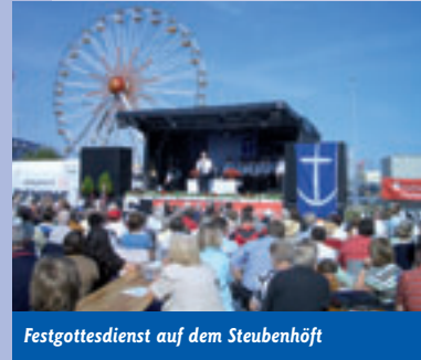
Festgottesdienst auf dem Steubenhöft